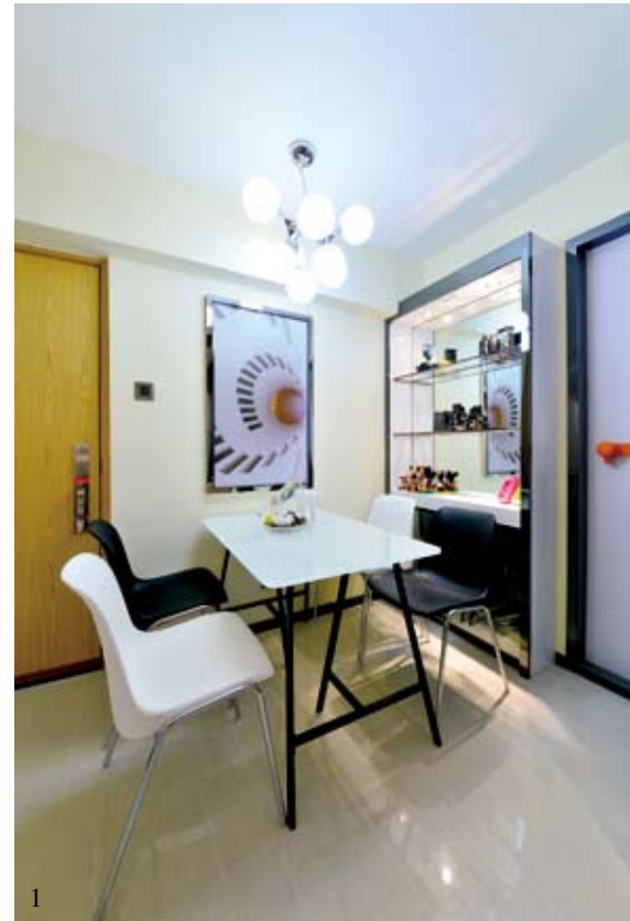
1/ 飯桌前的掛畫亦具貓頭，是幅抽象化的旋轉樓梯照片，與精心挑選的吊燈同樣擁有球形弧線。