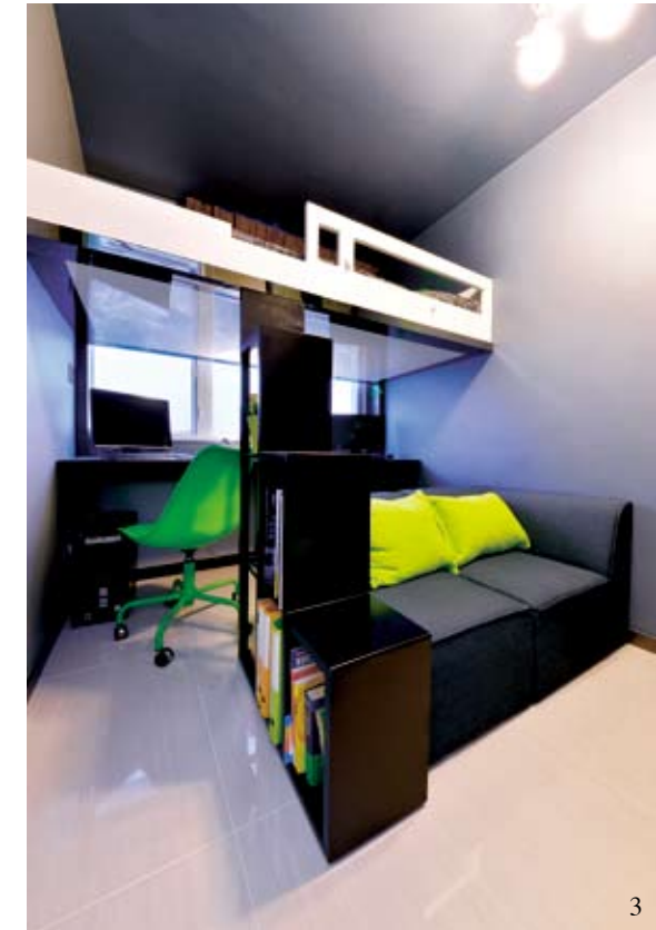
3/ 這個角度看來，簡直不敢相信這是不到60呎的迷你二人房。工作、玩樂，以至私隱空間盡皆齊全，就像自成一個居住單位。另一重點是以砂面灰鏡營造反光不反影效果，抑止眩目與混亂感。

相信不少香港讀者對俗稱「上下舖」的睡房佈局都不陌生，或許你也能從以下採光招數得到靈感——床底即書檯頂鋪上具有高反光度的白色鋼琴面物料，令白晝時，書檯燈透過反光板均勻折射回工作檯上；晚間工作時，書檯燈光更柔和舒適，不會因過強而刺眼，據設計師說還有另一個原因：「這樣男戶主在下層書檯用功時，就可只借助書檯燈，不妨礙上層的女戶主休息，認真貼心。」座落於地面上的樓梯狀書櫃設計，一方面為高架床作上落之用，另一方面增添了層層藏書空間。牆身連帶梳化大膽地配以深灰，空間雖窄，卻能自成一角寧靜氣氛。從而隔出房中房的分界，令年輕夫婦擁有一個設備齊全的玩樂、工作空間。