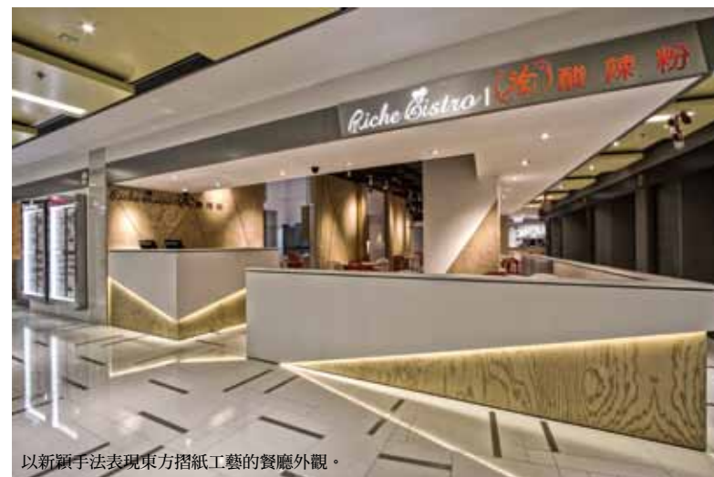
以新穎手法表現東方摺紙工藝的餐廳外觀。

包房區牆面上遊走著不規則的折線，凸顯戲劇化的動態韻律感。餐廳內 8 米高的植物牆形成另一視覺焦點，讓人有別有洞天的驚喜，盒內的祕密花園為空間增添清新放鬆的氛圍，舒緩用餐心情，在水泥城市中創造一處自然淨美之地。