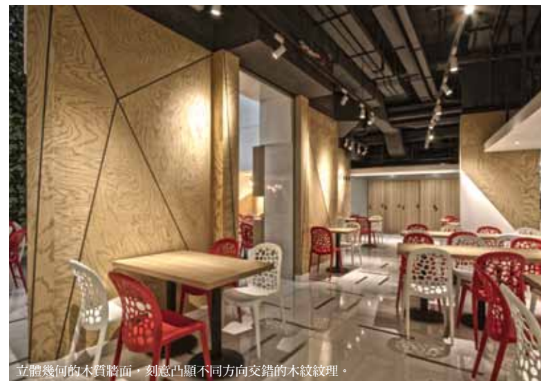
立體幾何的木質牆面，刻意凸顯不同方向交錯的木紋紋理。