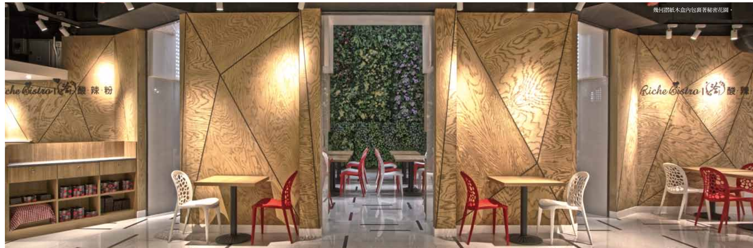
幾何摺紙木盒內包裹著祕密花園。