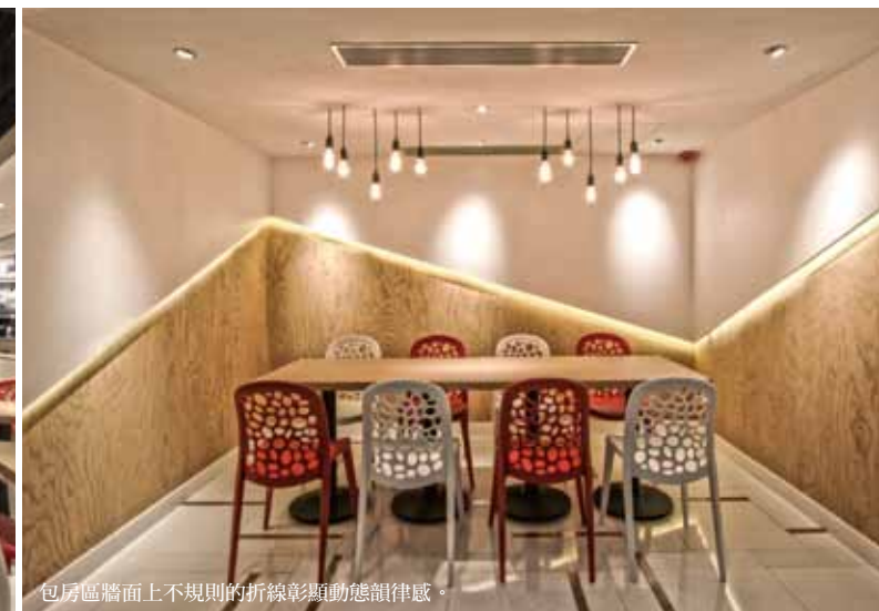
包房區牆面上不規則的折線彰顯動態韻律感。