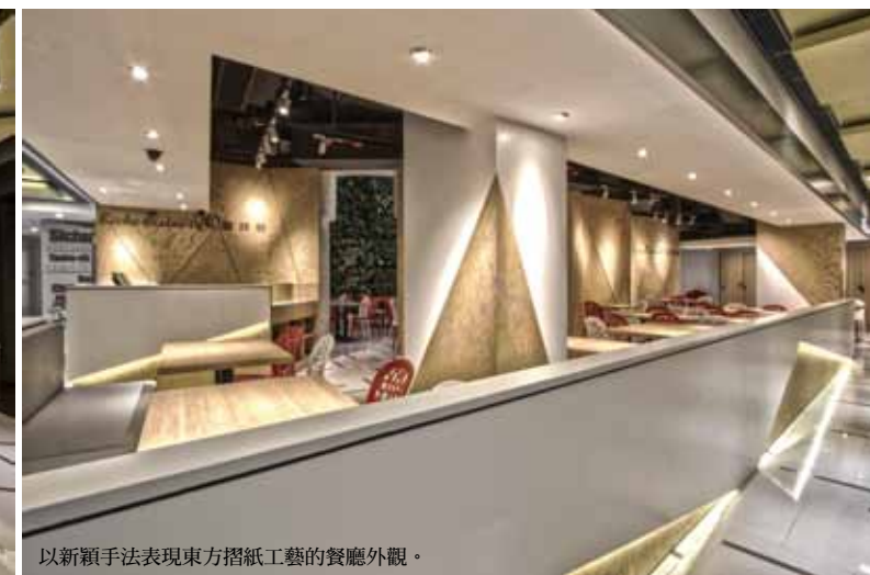
以新穎手法表現東方摺紙工藝的餐廳外觀。